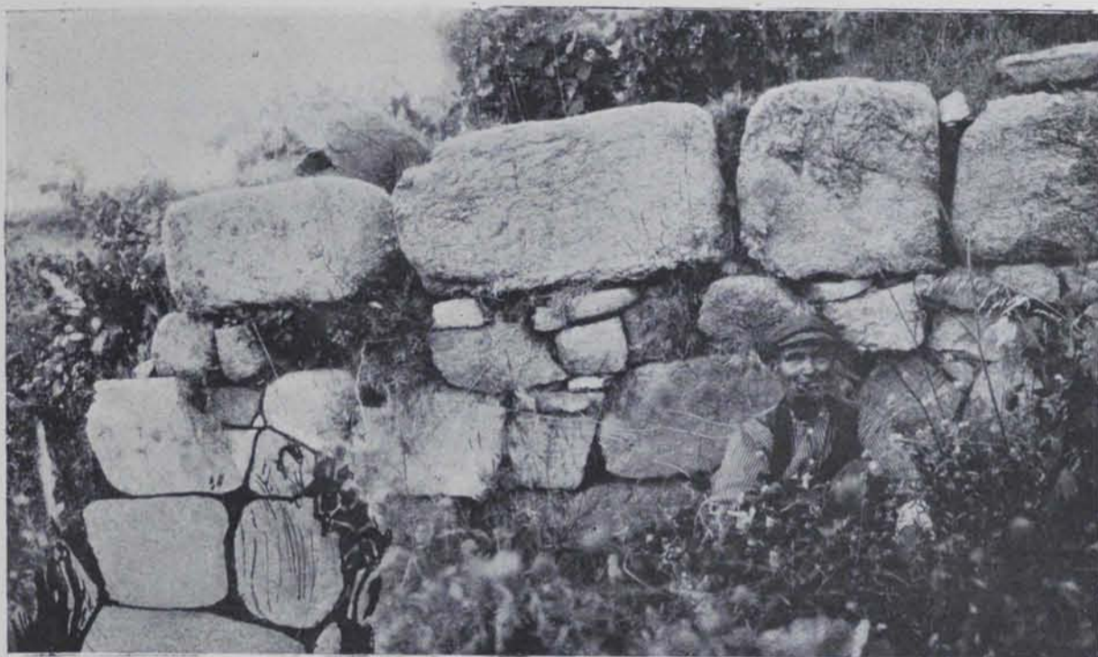
Fig. 134. — Sant Pol de Mar : Mur divisorí entre les plataformes inferior i central de la fortificació romana

reomplí amb pedres i terra, el lloc de la qual no és ara aparent. Tampoc no es veu on era l'entrada del recinte ni com es passava d'una plataforma a l'altra, coses que tal vegada es podrien determinar amb una excavació.