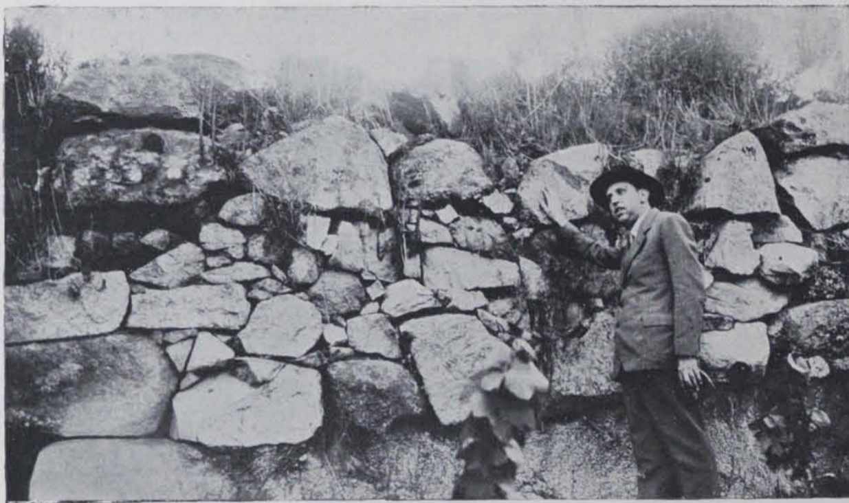
Fig. 133. — Sant Pol de Mar : Torre de la fortificació romana

Tots aquets murs, que a l'hora que delimiten i tanquen el reducte, sostenen les terres i són, per tant, visibles únicament per una cara, es conserven en alçàries variables entre 0,50 i 3 m. i en alguns llocs estan totalment enrunats. Cap d'aquests murs té fonaments: són aixecats sobre el sauló que forma el terreny. Els constitueixen filades de pedres grosses reblades, però sense gens de morter. La major part apareixen coronats per pedres més grosses que tenen fins a un metre de llargada. Aquests materials han estat portats de fora el turó format totalment de sauló. El sòl de la plataforma més alta és sensiblement pla, el de les altres té pendent vers el S., encara que poc forta. En tota l'extensió del recinte no són visibles altres parets que formessin cambres o compartiments més petits com trobaríem en un poblat; però tot fent un sondeig a la plataforma segona es descobrí quasi a nivell de terra, un paviment de picadís de 2 a 3 cm. de gruix, i, en aquesta mateixa plataforma, un pagès que hi havia treballat