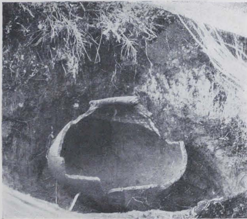
Fig. 131. — Sant Pol de Mar : Dòlium trobat a la partida de Morè

A llevant de Sant Pol seguint la vorera del mar i passat el turó on hi ha les restes del monestir que va donar origen a la vila, s'estén un tros de platja que rep el nom de platja de Morè, nom que es dona igualment a la petita vall que allí va a morir. En el centre d'aquesta partida i a uns centenars de metres del mar hi ha una rajoleria prop de la qual en 1918 va ésser descobert un dòlium. En el lloc on hi ha el forn actual, segons la dita del rajoler, es trobaren fa molt temps restes d'altres forns més antics dels quals ara no en queda res. En el fons d'una bassa, a tres metres sota el nivell actual de la terra aparegueren restes humanes i sílexs (sobre la forma dels quals no podem precisar res). És possible que fossin enterraments neolítics dels que tants exemplars hi ha a la comarca (Badalona, Vilassar de Dalt, Mataró).